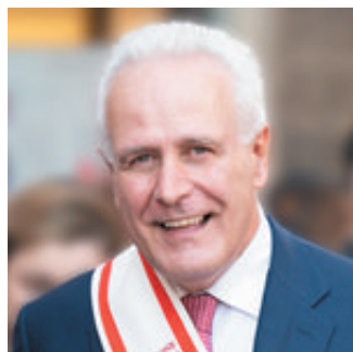
Eugenio Giani Presidente Regione Toscana

P oche regioni riescono a rappresentare il life style italiano come la Toscana, un territorio che da sempre guarda alla qualità della vita ma che è anche ricco di eccellenze locali. Realtà imprenditoriali che grazie alla capacità di saper cavalcare l'innovazione riescono a vincere le sfide in